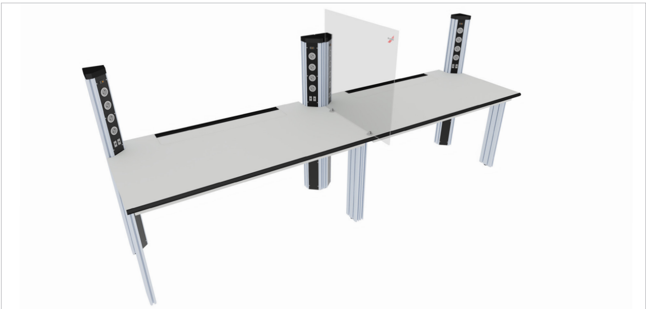
Seitliche Hygieneblende auf Anfrage.